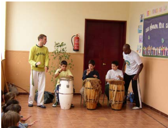
一堂跨文化交流課

每所學校都以一本兒童權利手冊和《地球憲章》為基礎來研發學校各自的系列活動。然後，再鼓勵老師依此拓展自己的願景。通過簡明的插圖來表現地球是人類的家園，這樣連三歲的幼兒都能夠對《地球憲章》有最初步的認識。對於年長一些的兒童，則可以建議基於《地球憲章》的諸如文化交流研討會，或攝影比賽等活動，