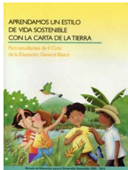
哥斯大黎加《地球憲章教師手冊》封面