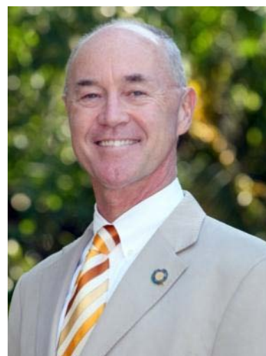
主編：彼得佈雷斯·科克倫

該書展現了地球憲章在多元文化與地理環境的情境下是如何被運用的。包括如何幫助連接伊斯蘭教和基督教的世界，及南北半球合作。該書沿襲了地球憲章原則的框架，並展示了它迎接全球性挑戰的功效。