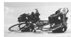
利用人力周游世界

當“探索旅行”隊伍拜訪一個社區時，他們傳遞《地球憲章》的資訊，並在學校舉行《地球憲章》和探索旅行中熱點話題的討論會。所有報名“探索學校課堂”（Brink School Room）的學校收到了一個學習袋（School Pack），內容包含《地球憲章》、兒童版《地球憲章》、和聯合國教科文組織發行的CD—《可持續未來的教學》、以及其他由探索隊提供的相關材料。“探索學校課堂”的網站目前已經有包括澳大利亞、美國、委內瑞拉、智利、阿根廷、哈薩克斯坦、西班牙和瑞典等國家的65所學校的參與。