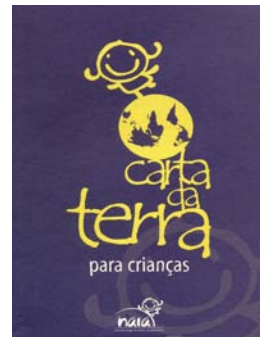
巴西兒童版《地球憲章》畫冊封面

由於本身從事教育工作，我須要不斷地尋找合適的教學資源，來鼓勵學生更加關注周遭世界，並讓他們知道自己在未來所要扮演的重要角色。我發現《地球憲章》是個非常有價值的工具，它幫助我們看到自己原來屬於一幅大畫作中的一小部分，並且我們需要互相合作。