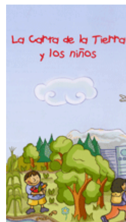
为该项目开发开发的儿童教材

由於以《地球憲章》為基礎的教育取得了成功，發起的老師計畫將他們的經驗與墨西哥摩利亞（Morelia）和薩卡特卡斯（Zacatecas）地區的學校分享，並推廣《憲章》。